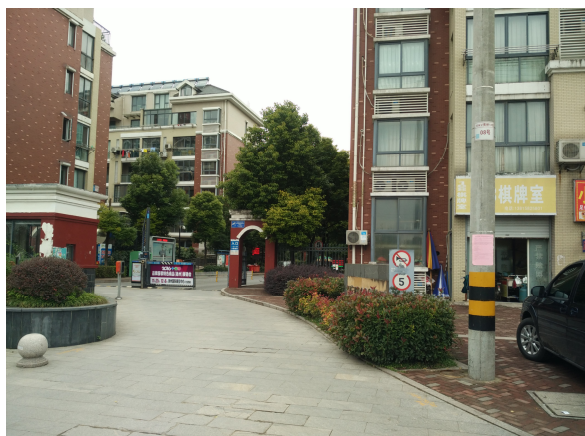
西郡 188 花园公示图